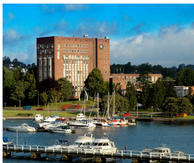
Rica Park Hotel v/ havnen