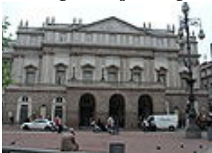
Operaen La Scala.

Vi forlater Lugano og kjører inn i Italia. Dagens lunsjpause tar vi i Milano. Her blir det noe tid på egen hånd. Benytt muligheten til å se den verdensberømte La Scala! Kanskje rekker du også å få med deg Leonardo da Vincis bilde "Det siste måltidet", som henger i klosteret Santa Maria delle Grazie. Vi fortsetter videre langs østsiden av Gardasjøen mot Riva. Innsjekk og middag på Hotel Astoria Park.