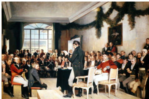
Riksforsamlingen på Eidsvoll 1814/ maleri av Oscar Wergeland. Eidsvollsbygningen til høyre