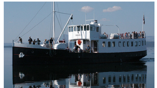
Fæmund II