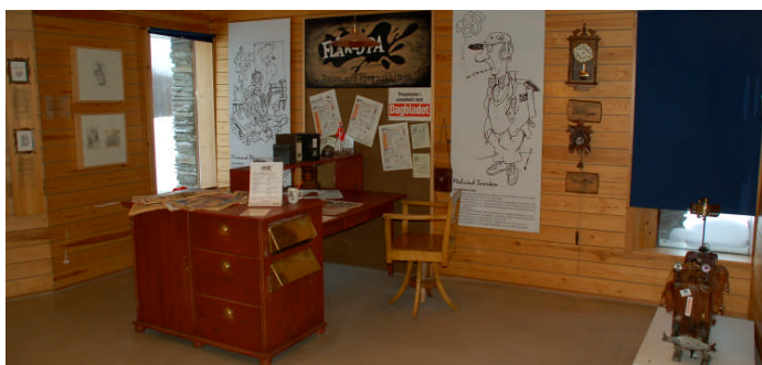
Fra redaksjonen i Flåklypa Tidende

Tiden for avreise nærmer seg, og vi tar farvel med Femunden. På hjemveien kjører vi om Tolga og fortsetter nedover Østerdalen til Aukrustsenteret. Her står kveldsbufféen klar. Og synes vi at vi har tid til det, så tar vi vel en liten kikk på alle de fantastiske personer og innretninger Kjell Aukrust klarte å skape.